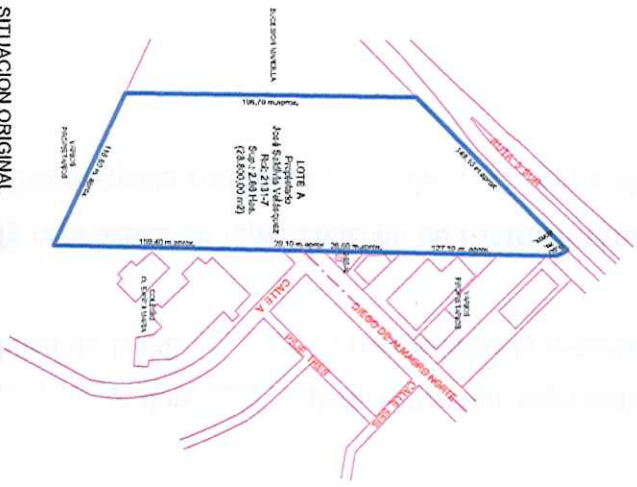
SITUACION ORIGINAL LOTE A Superficie: 2,88 Has. (28,800.00 m2)